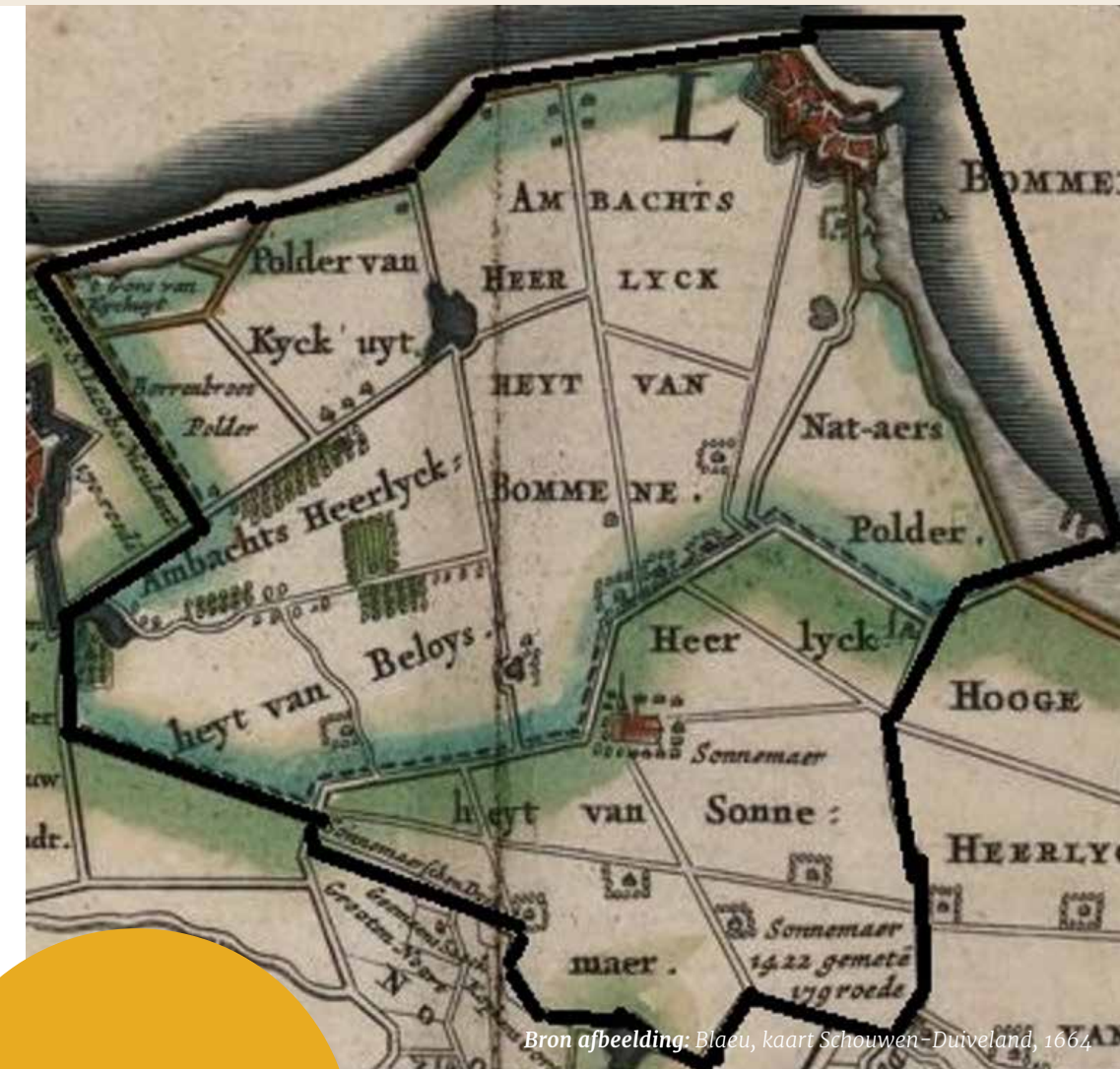
Bron afbeelding: Blaeu, kaart Schouwen-Duiveland, 1664